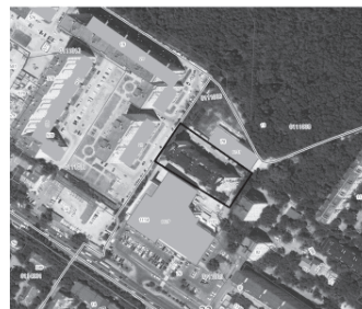
СХЕМА ГРАНИЦ ТЕРРИТОРИИ ПРОЕКТА МЕЖЕВАНИЯ ТЕРРИТОРИИ С ЦЕЛЬЮ ПОСТАНОВКИ ЗЕМЕЛЬНОГО УЧАСТКА НА ГОСУДАРСТВЕННЫЙ КАДАСТРОВЫЙ УЧЕТ ДЛЯ ЭКСПЛУАТАЦИИ МНОГОКВАРТИРНОГО ЖИЛОГО ДОМА ПО АДРЕСУ: Г. НОВОРОССИЙСК, АНАПСКОЕ ШОССЕ, Д. 37А

Условные обозначения: — - граница территории