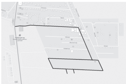
СХЕМА ПРОЕКТА ПЛАНИРОВКИ ТЕРРИТОРИИ (ПРОЕКТ ПЛАНИРОВКИ И ПРОЕКТ МЕЖЕВАНИЯ) ПО ОБЪЕКТУ: «ИНЖЕНЕРНОЕ ОБЕСПЕЧЕНИЕ ЮЖНОГО ВНУТРИГОРОДСКОГО РАЙОНА Г. НОВОРОССИЙСКА. УЛИЧНЫЕ СЕТИ ГАЗОСНАБЖЕНИЯ (УЛ. ГРИГОРИЯ БЕЛЬКИНДА, УЛ. АНДРЕЯ РУБЛЕВА)» ПО АДРЕСУ: Г. НОВОРОССИЙСК, УЛ. РУЧЕЙНАЯ, УЛ. СУДЖУКСКАЯ, УЛ. ГРИГОРИЯ БЕЛЬКИНДА, УЛ. АНДРЕЯ РУБЛЕВА, ОБЩЕЙ ПРОТЯЖЕННОСТЬЮ - 2000 МЕТРОВ (ОРИЕНТИРОВОЧНО)

Условные обозначения: — - граница территории