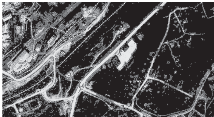
Схема размещения рекламной конструкции № 1 на территории муниципального образования город Новоросси́йск по адресу: город Новоросси́йск, в п. Верхнебаканский, ул.Баканская, в районе д. № 8А, на земельном участке с кадастровым номером 23:47:0106001:31

Условные обозначения: - место установки рекламной конструкции