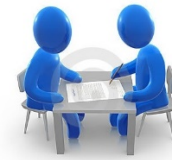
Личное обращение в ведомство