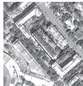
СХЕМА ГРАНИЦ ТЕРРИТОРИИ ПРОЕКТА МЕЖЕВАНИЯ ТЕРРИТОРИИ С ЦЕЛЬЮ ПОСТАНОВКИ ЗЕМЕЛЬНОГО УЧАСТКА НА ГОСУДАРСТВЕННЫЙ КАДАСТРОВЫЙ УЧЕТ ДЛЯ ЭКСПЛУАТАЦИИ МНОГOKВАРТИРНОГО ЖИЛОГО ДОМА ПО АДРЕСУ: Г. НОВОРОССИЙСК, УЛ. СОВЕТОВ, Д. 66

Условные обозначения: — - граница территории