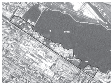
СХЕМА ГРАНИЦ ТЕРРИТОРИИ ПОДГОТОВКИ ПРОЕКТА ПЛАНИРОВКИ И ПРОЕКТА МЕЖЕВАНИЯ ДЛЯ РАЗМЕЩЕНИЯ ЖИЛОЙ ЗАСТРОЙКИ, НА ТЕРРИТОРИИ ОГРАНИЧЕННОЙ УЛИЦАМИ АНАПСКОЕ ШОССЕ - ТОБОЛЬСКАЯ - ЛУНАЧАРСКОГО В Г. НОВОРОССИЙСКЕ

Условные обозначения: — - граница территории