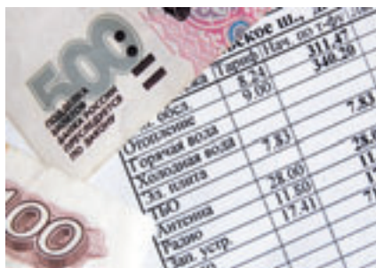
■ ОПЛАТА КОМПЕНСАЦИЙ ПО ЖКХ - ОДНА ИЗ СТАТЕЙ РАСХОДА ГОРОДСКОГО БЮДЖЕТА

В целях обеспечения выполнения обязательств по заработной плате работников бюджетных учреждений, социальным