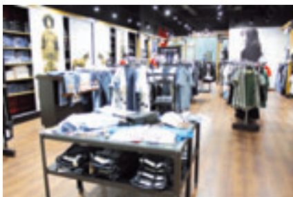
■ В ТОРГОВЫХ ПРЕДПРИЯТИЯХ ГОРОДА

ственного питания и бытовых услуг города работает свыше 30 тысяч человек .