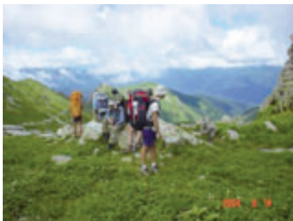
■ НА ТУРИСТИЧЕСКИХ ТРОПАХ

В ходе подготовки к летнему оздоровительному сезону была усовершенствована материально-техническая база ряда предприятий отрасли: выполнены мероприятия по реконструкции номерного фонда – пансионаты «Моряк», «Заездный», им. А.И. Майстренко («Жемчужина»); проведены строительные работы в пансионате «Метроклуб»; организовано общественное питание по типу «шведский стол» в б/о «Лесная поляна».