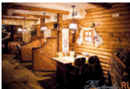
■ ПРЕДПРИЯТИЯ ОБЩЕСТВЕННОГО ПИТАНИЯ ГОРОДА

ющих) составляет 51,3 на 1000 жителей, при нормативе 45.