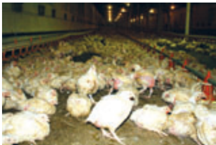
■ ПТИЦЕФАБРИКА «НОВОРОССИЙСКАЯ»

Предоставлены субсидии 20 личным подсобным хозяйствам в сумме 245,8 тыс.