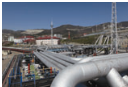
■ ТРАНСПОРТНЫЕ УСЛУГИ НОВОРОССИЙСКА

В сельском хозяйстве крупными и средними предприятиями отрасли допущено снижение объёмов продукции на 64,2 млн. руб., или на 11,5% (таблица №1).