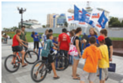
■ ЮНЫЕ НОВОРОССИЙЦЫ - ЖИТЕЛИ ЦЕНТРАЛЬНОГО ВНУТРИГОРОДСКОГО ОКРУГА ГОРОДА

Количество торговых площадей на территории Центрального района составляет (включая рынки) 197 800 кв. м. , или