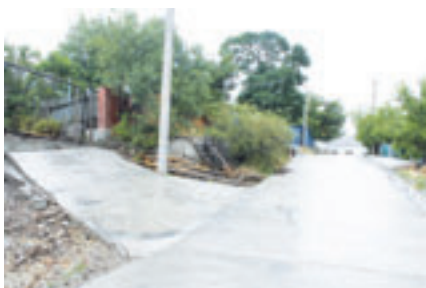
■ СТРОИТЕЛЬСТВО ДОРОГ НА «ТОЙ СТОРОНЕ» МЕТОДОМ «НАРОДНОЙ СТРОЙКИ»

крёстка улиц Леженина и Черняховского, ул. Козлова (от ул. Кутузовской до ул. Чайковского), перекрёстка пр. Ленина – ул. Куникова, проездов по ул. Л-та Шмидта и др.