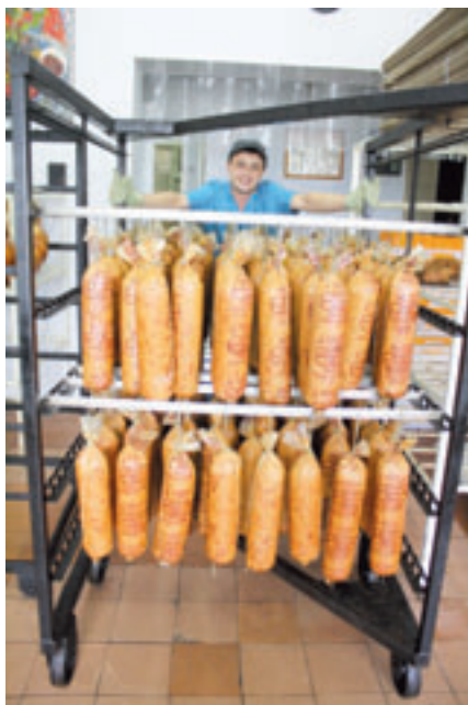
■ ПРОДУКЦИЯ ОТПРАВЛЯЕТСЯ В РЕАЛИЗАЦИЮ

На рынок продуктов питания приходится 38% общего товарооборота Новороссийска, на рынках города реализуется 25% от общего товарооборота (в 2009 г. этот показатель составлял 30% ). Ассортимент продовольственных товаров в ряде сетевых магазинов достигает 20 тысяч наименований . При этом 2/3 реализуемых товаров – отечественного производства. Как показывает анализ, у местных производителей имеется устойчивая торговая ниша. В 2010 году доля краевых