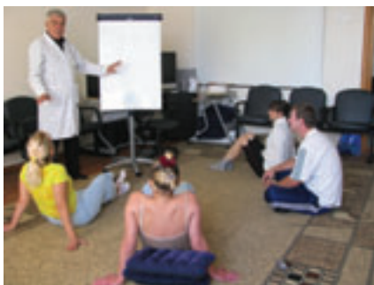
■ В МЕДУЧРЕЖДЕНИЯХ ГОРОДА

заболеваемости вирусными гепатитами (на 100 тыс. населения) – 8,03 в 2010 году, 9,08 – в 2009 году (среднекраевой показатель – 13,6).