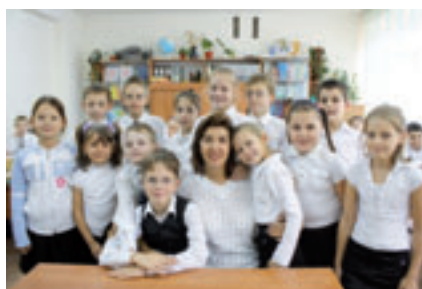
■ В ШКОЛАХ ГОРОДА НОВОРОССИЙСКА

тельных учреждений – 33 (начальная школа – 1, основных школ – 3, лицеев – 2, гимназий – 7, средних школ – 19, вечерняя школа – 1);