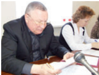
■ ТРАДИЦИОННЫЙ ЕЖЕМЕСЯЧНЫЙ ПРИЁМ ГЛАВЫ ДЛЯ ЖИТЕЛЕЙ НОВОРОССИЙСКА