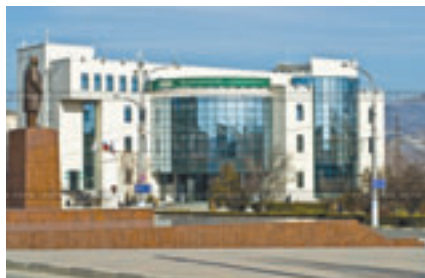
■ ОФИС СБЕРБАНКА НА УЛ. СОВЕТОВ