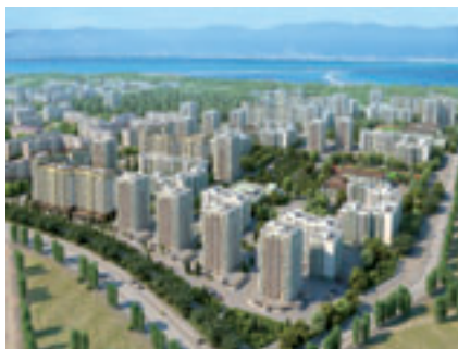
■ ПЕРСПЕКТИВА ЗАСТРОЙКИ МИКРОРАЙОНОВ ГОРОДА

Введено в эксплуатацию жилья с учётом индивидуального строительства по итогам 2010 года – 178,7 тыс. кв. м. Построено 1313 квартир , из них более половины – социальное жильё, в том числе 400 квартир для военнослужащих, 128 – для ветеранов ВОВ (70 ветеранов получили квартиры в новом доме), 25 – для детей-сирот, 169 – для переселенцев из ветхого жилья.