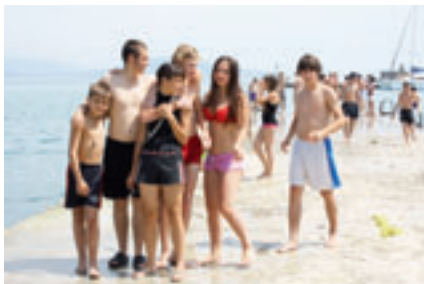
■ ЦЕНТРАЛЬНЫЙ ПЛЯЖ ГОРОДА

рии муниципального образования город Новорossiysk осуществляли свою деятельность 7 пляжных территорий общего пользования – «Алексино», «Суджукская Коса», «Центральный городской пляж», «Широкая Балка», «Дюрсо», «Южная Озеревка», «Лабанова щель».