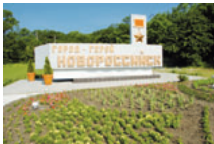
■ ВЪЕЗДНАЯ ГРУППА В ГОРОД-ГЕРОЙ НОВОРОССИЙСК

Забота о ветеранах войны и труда, социально уязвимых группах населения, о подрастающем поколении оставалась в