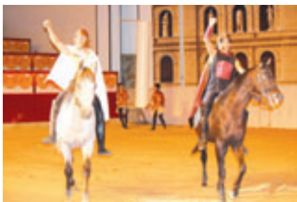
■ КОННО-ИСТОРИЧЕСКОЕ ШОУ «РИМ» (С. АБТАУ-ДЮРСО)

Наряду с объектами показа, посвященными событиям Великой Отечественной войны, в отчетном периоде появились объекты другой тематической направленности: