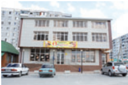
■ ТОРГОВОЕ ПРЕДПРИЯТИЕ СРЕДНЕГО БИЗНЕСА

низовано и проведено 8 совещаний «День открытых дверей», в которых приняли участие более 800 предпринимателей . Подготовлено и проведено 4 заседания Координационного совета, в работе каждого из которых приняли участие более 30 членов Координационного совета .