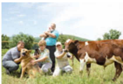
■ НА ОБЪЕКТАХ МАЛОГО И СРЕДНЕГО ПРЕДПРИНИМАТЕЛЬСТВА

В целях реализации программы поддержки малого и среднего бизнеса, администрация города в отчетный период осуществляла тесное взаимодействие с представителями деловых кругов, организациями, объединяющими предпринимателей.